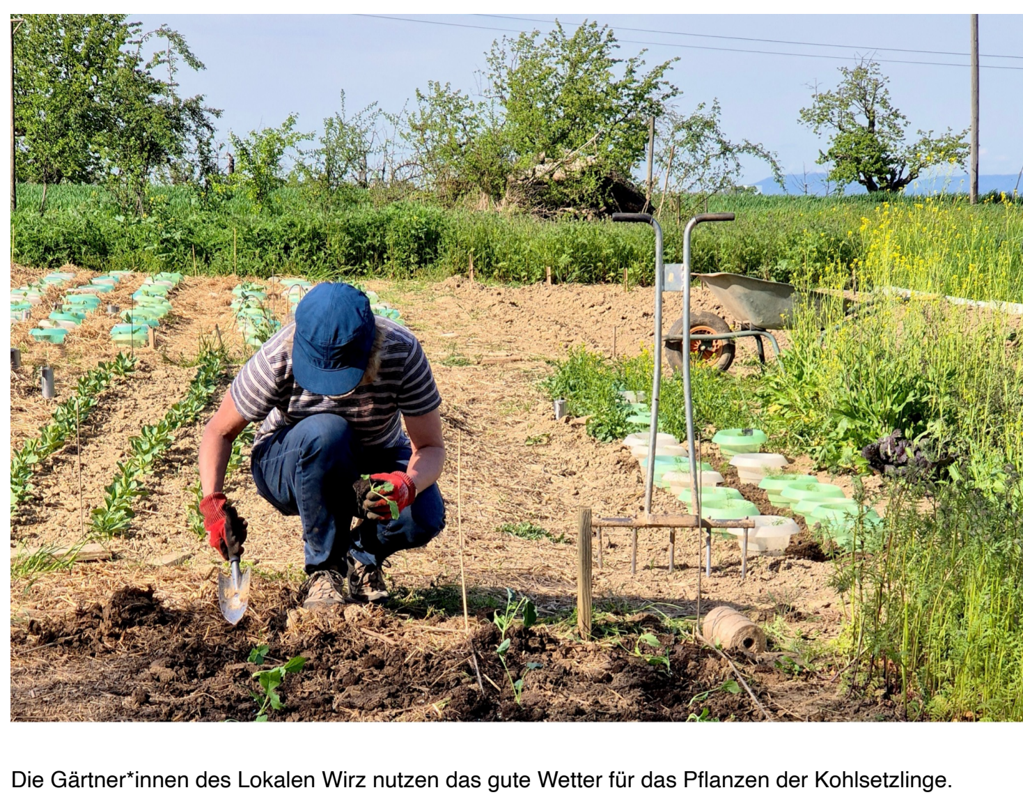
Die Gärtner*innen des Lokalen Wirz nutzen das gute Wetter für das Pflanzen der Kohlsetzlinge.