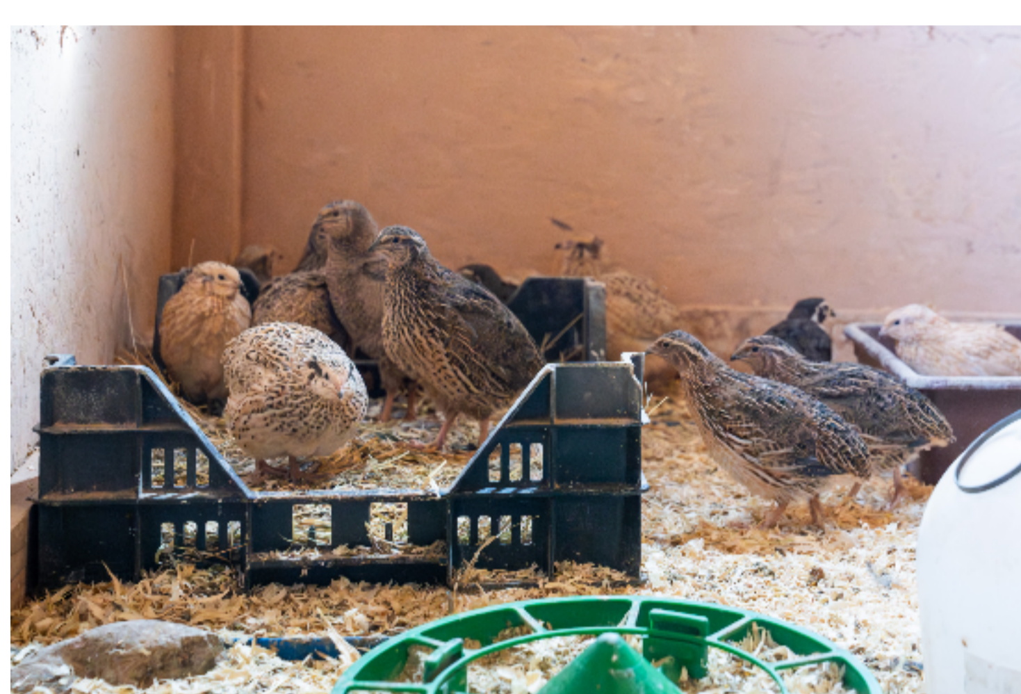
Die jungen Wachteln sind mittlerweile grösser und legen bereits Eier.

Die Predigerhof-Wachteln sind sehr fleissig. Ihre schönen Mini-Eier sind besonders gesund. Sie enthalten mehr Eisen, Vitamin B1 und B12 und weniger Cholesterin als Hühnereier.